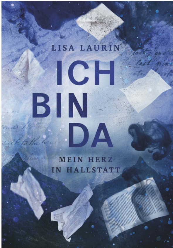
Cover by Schattmaier Design