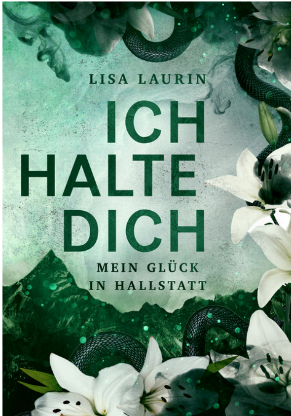
Cover by Schattmaier Design