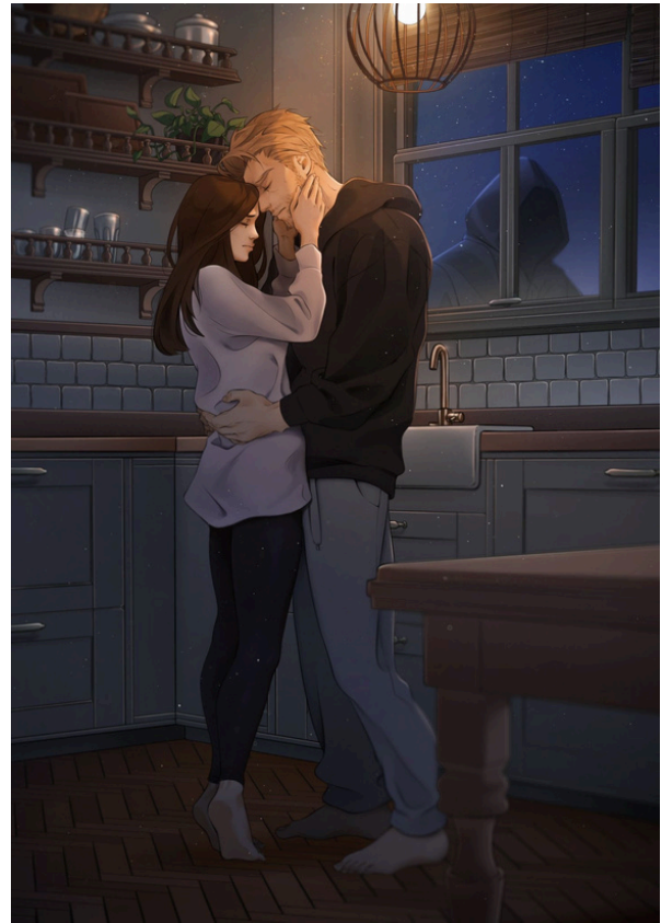
Illustration Charakterkarte by bkatz Design