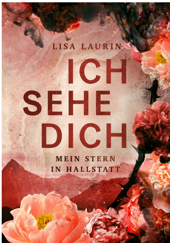
Cover by Schattmaier Design