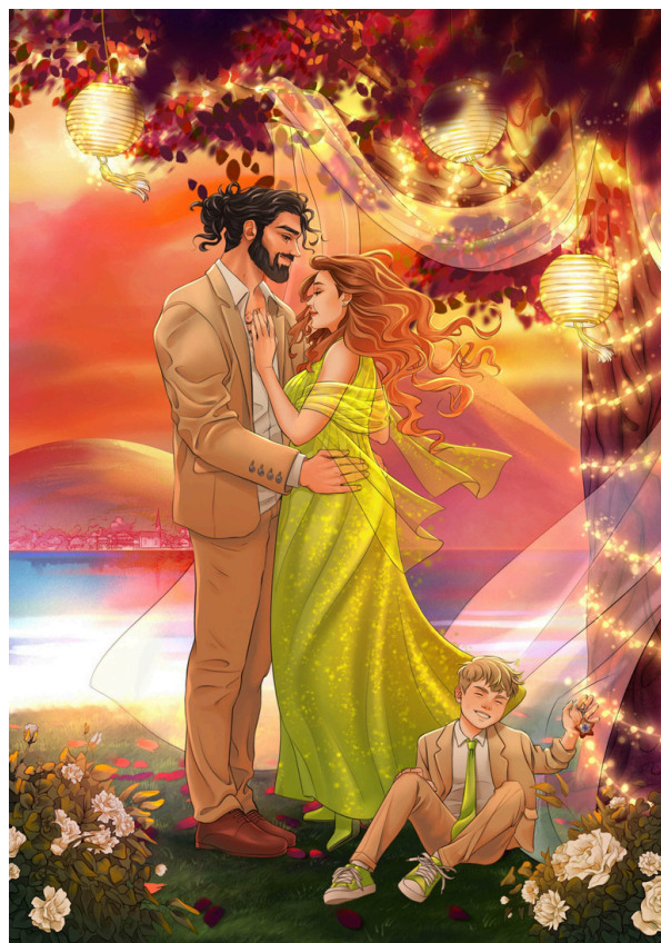
Illustration Charakterkarte by bkatz Design